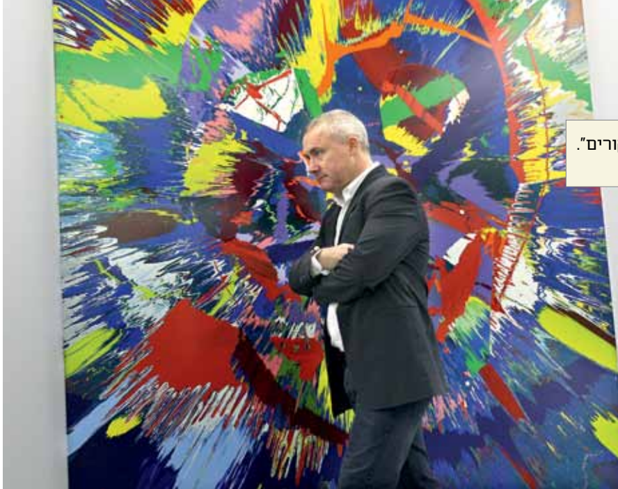
”מחפש את אור הזרקורים” דמיאן הירסט

הסיכוי שערכה יעלה, גם אם הם לא מוכרים אותה. זה סוג של חותם של הצלחה. אם קניתי אמן שערכו עלה, גם אם איני מוכר, זה מעיד על כך שיש לי עין טובה.