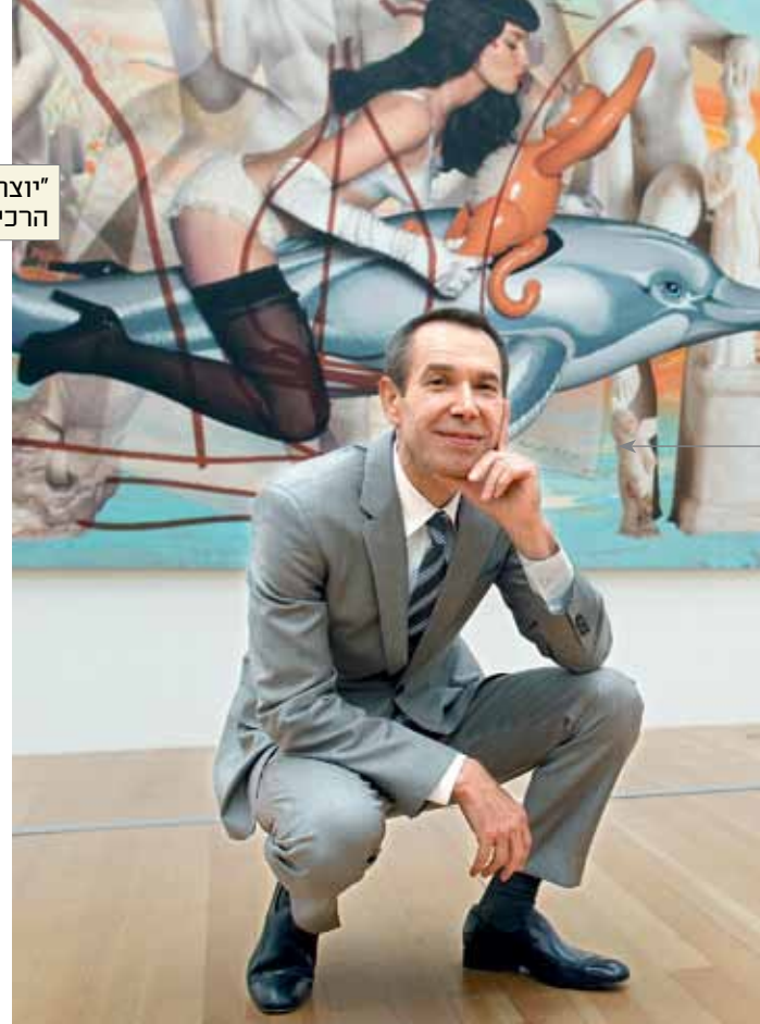
"יוצר כותרות במדורי הרכילות". ג'ף קונס

"להפך. הרבה פחות נגישה, בגלל שהיא לא מובנת מאלה. האמנות עברה לפאזה תיאורטית. היא דורשת תיווך. כבר אי אפשר להסתכל עליה ולקבוע יפה'לא יפה, טוב'לא טוב, בלי שום רקע, בלי להכיר את האמן, מה מניע אותו, מאיפה הוא בא. ולמרות המבוכה שזה יוצר לאנשים שאינם יודעי דבר, ברגע שלומדים, שומעים, חוקרים ומבינים, זה מעשיר את עולמך. לאנשים לא נעים לשאול, הם מתביישים, וחבל. אסור להתבייש, צריך לשאול, ואז מקבלים תשובות מרתקות.