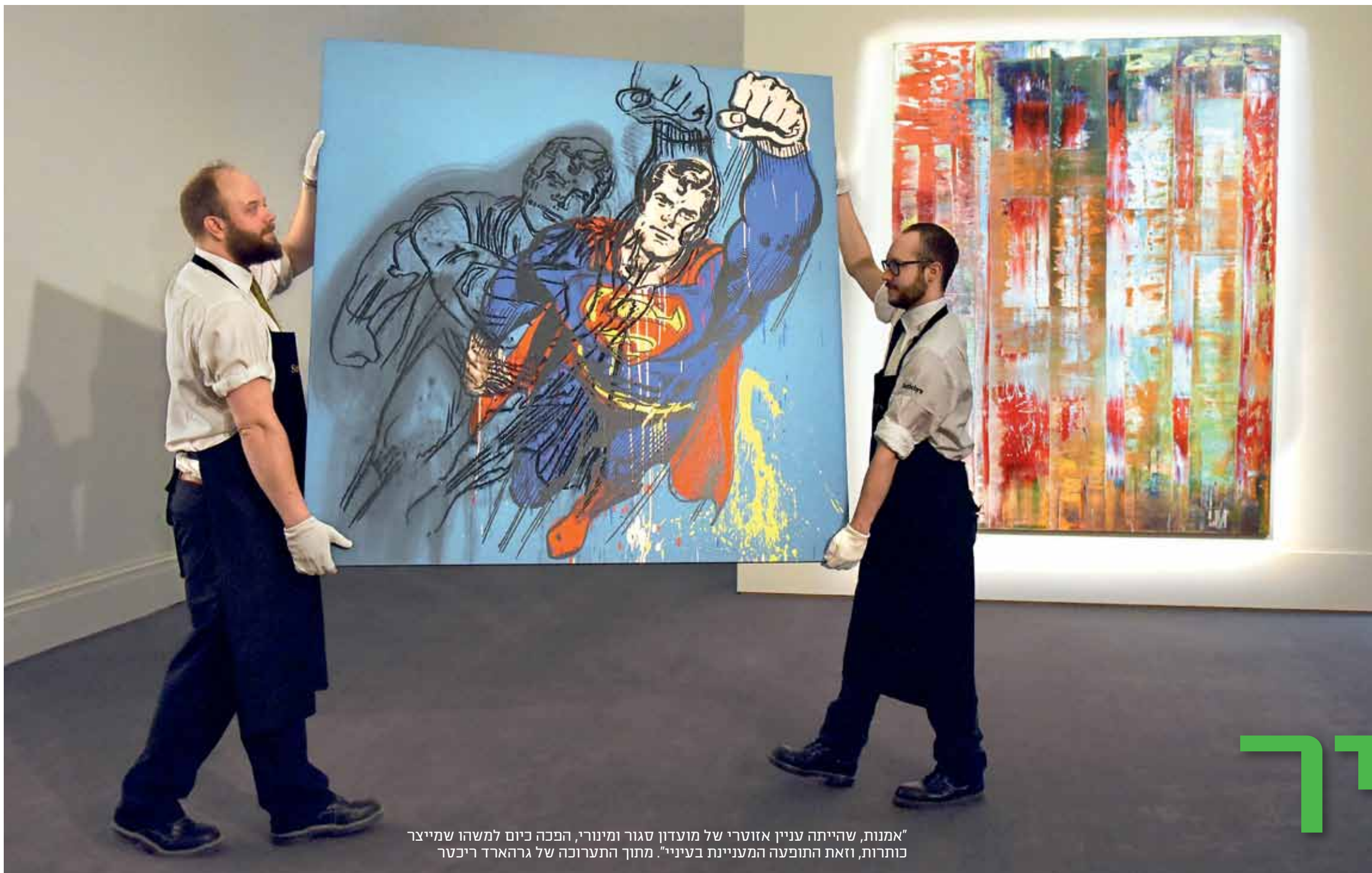
"אמנות, שהייתה עניין אזוטרי של מועדון סגור ומיונרי, הפכה כיום למשהו שמיציר כותרות, וזאת התופעה המעניינת בעיניי". מתוך התערוכה של גרהארד ריכטר