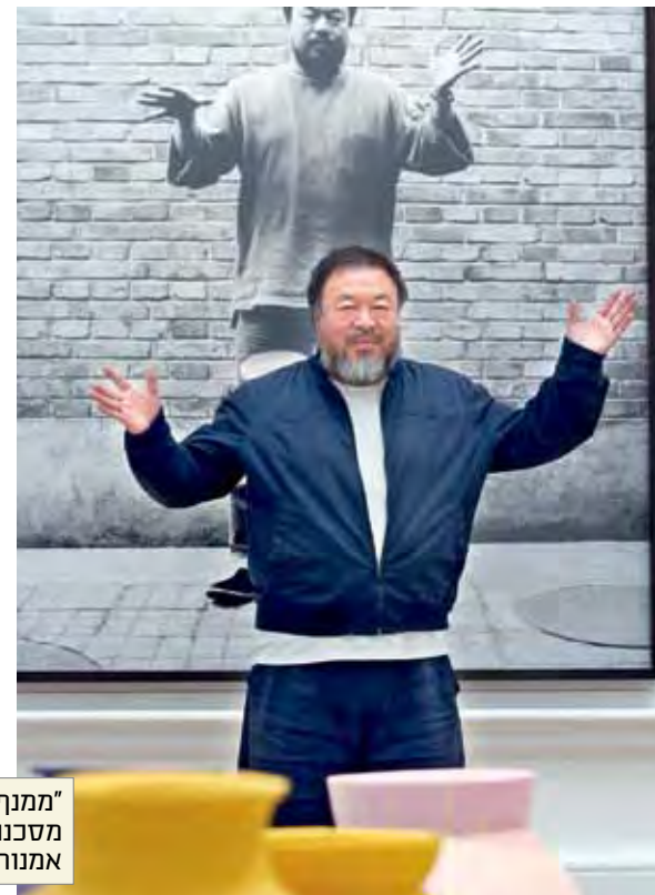
”ממנף את מסכנותו למכירת אמנותו”. אי ויו

”אני לא זוכרת בחירה מודעת, אבל זה נראה לי מאוד טבעי ללכת אחרי הצבא ללמוד אמנות. התקבלתי למדרשה והתחלתי באופן טבעי לעבוד בגלריה. לא עצרתי ושאלתי את עצמי. בלימודים הבנתי שאמנית טובה לא אהיה, ובינוניים יש מספיק, אז אוותר לעולם על עוד אחת.”